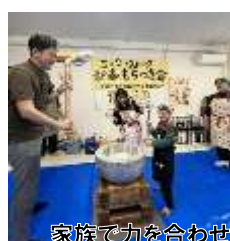
家族で力を合わせて！