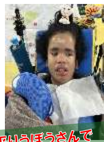
大平りうぼうさんで