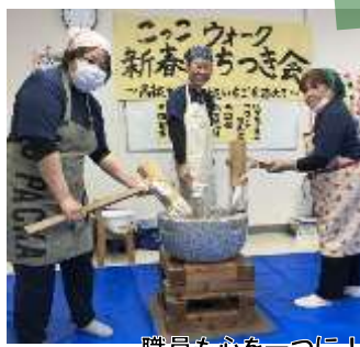
職員も心を一つに！