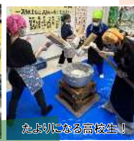
たよりになる高校生！