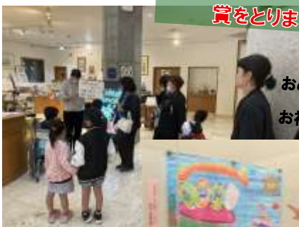
おめでとう☆みんなでお祝いしようね!!